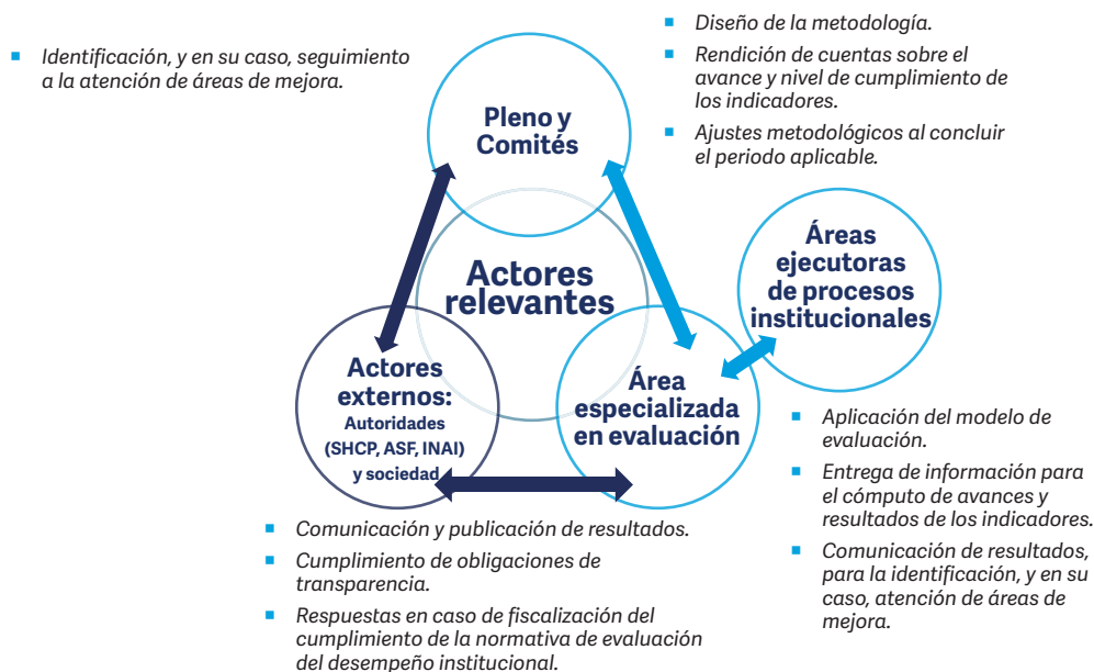
Gráfico 2 . Etapas del SEDI 2022-2025

La adecuada implementación del SEDI requiere de la participación y colaboración de distintos actores internos y externos a la Comisión; así como de las interacciones de la COFECE con la sociedad y otras autoridades (ver Gráfico 2).