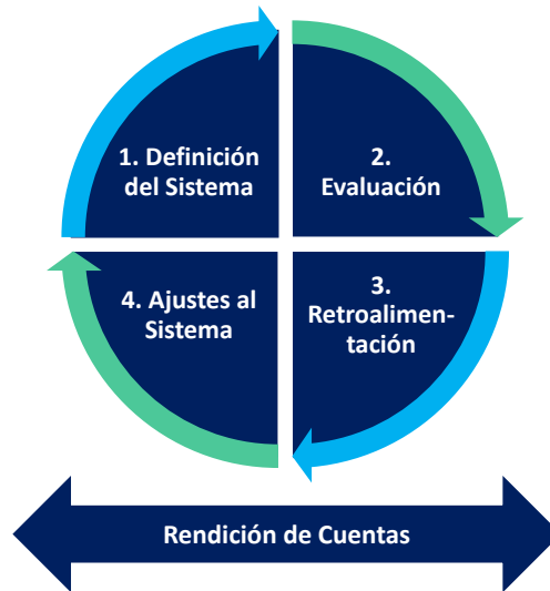
Gráfico 1. Etapas del SEDI 2022-2025

El SEDI es un instrumento de carácter estratégico y de mejora continua de la COFECE, que se desarrolla en cuatro etapas (ver Gráfico 1):