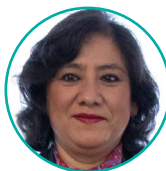
Irma Eréndira Sandoval Secretaria de la Función Pública