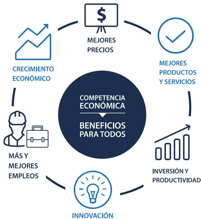
Figura 1. Beneficios de la competencia

Competencia económica es el esfuerzo que realizan dos o más personas, comercios o empresas, para incrementar su participación en el mercado, ofreciendo más opciones de productos y servicios de mayor calidad a mejores precios. Cuando existe un ambiente de competencia, el éxito de cada empresa está determinado por su capacidad para conquistar la preferencia del consumidor. Así, la competencia en los mercados facilita y estimula una mayor oferta y diversidad de productos y servicios, a menores precios y con mayor calidad. De esta forma, la competencia incrementa el poder adquisitivo y el bienestar de los consumidores. También permite a las empresas acceder a insumos en condiciones competitivas, las incentiva a innovar y a ser más productivas. Por todo lo anterior, la competencia conlleva un círculo virtuoso que genera crecimiento y desarrollo económicos.