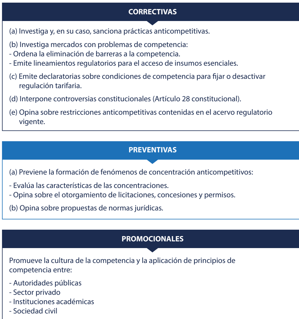
Figura 2. Atribuciones de la autoridad de competencia

Existe un amplio consenso respecto de los beneficios de la política de competencia y su relevancia para el país. Esto derivó en las reformas constitucionales en materia económica aprobadas en 2013, que consolidaron e impulsaron los cimientos institucionales de esta política.