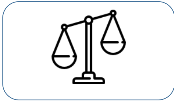
Nivel óptimo de la sanción