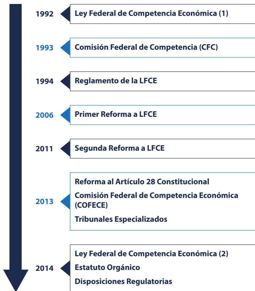
Figura 3. Evolución del marco institucional y jurídico de competencia en México

En México, la competencia económica es un bien tutelado por el artículo 28 constitucional. Aunque la primera ley de la materia data de 1992, el sistema fue reforzado recientemente a través de una reforma constitucional (2013) y la emisión de la nueva Ley Federal de Competencia Económica (2014) (LFCE o Ley). A raíz de estos sucesos, el país ha pasado por un importante proceso de fortalecimiento institucional. Los principales momentos en la evolución del marco institucional y jurídico de competencia se muestran en la Figura 3.