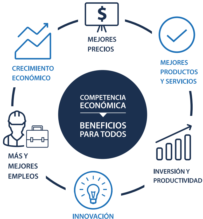
Figura 1. Beneficios de la competencia

Cuando existe un ambiente de competencia, el éxito de cada empresa está determinado por su capacidad para conquistar la preferencia del consumidor. Así, la competencia en los mercados facilita y estimula una mayor oferta y diversidad de productos y servicios, a menores precios y con mayor calidad. De esta forma, la competencia incrementa el poder adquisitivo y el bienestar de los consumidores. También, permite a las empresas acceder a insumos en condiciones competitivas, las incentiva a innovar y a ser más productivas. Por todo lo anterior, la competencia conlleva un círculo virtuoso que genera crecimiento y desarrollo económicos.